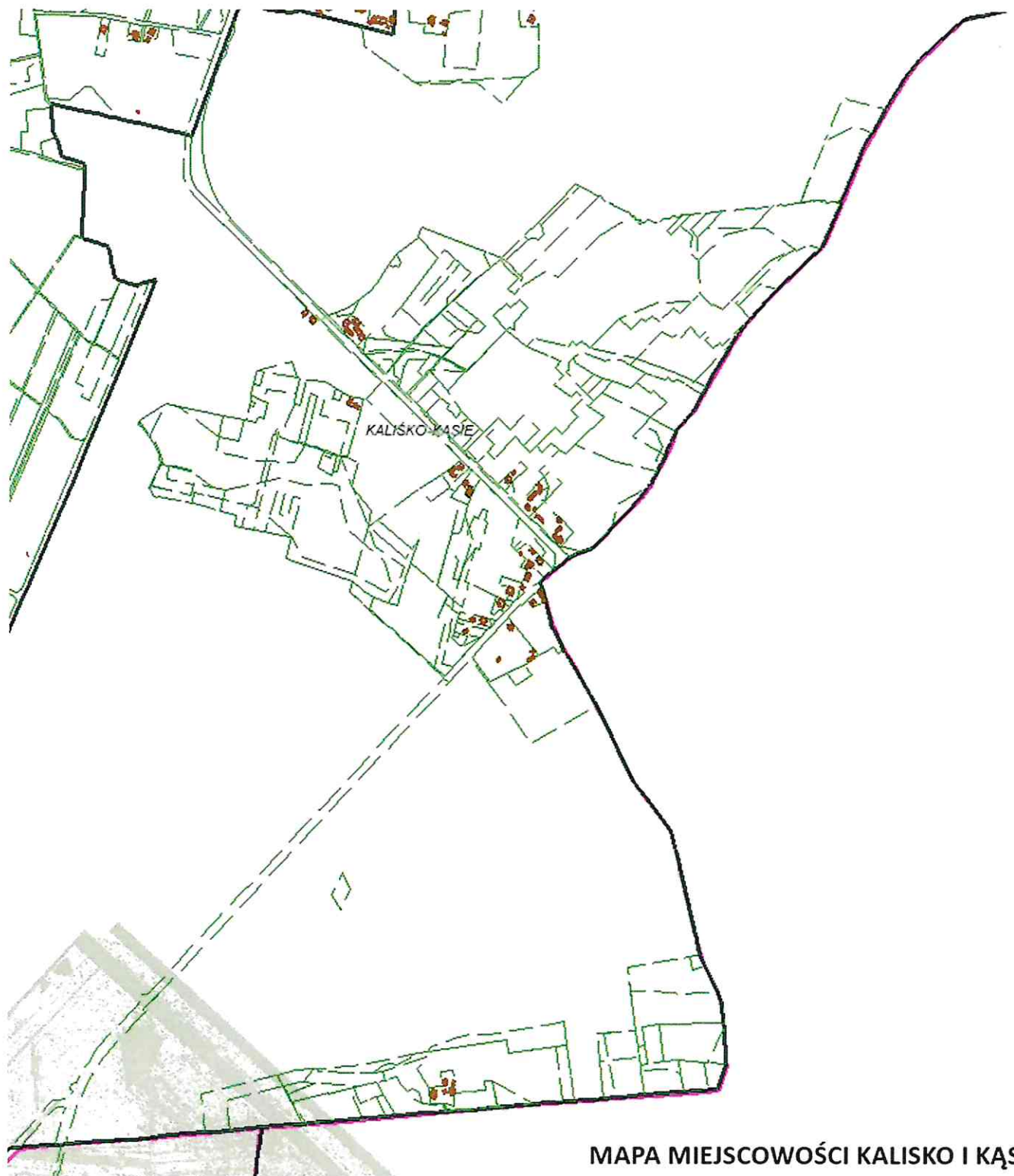
MAPA MIEJSCOWOŚCI KALISKO I KĄSIE