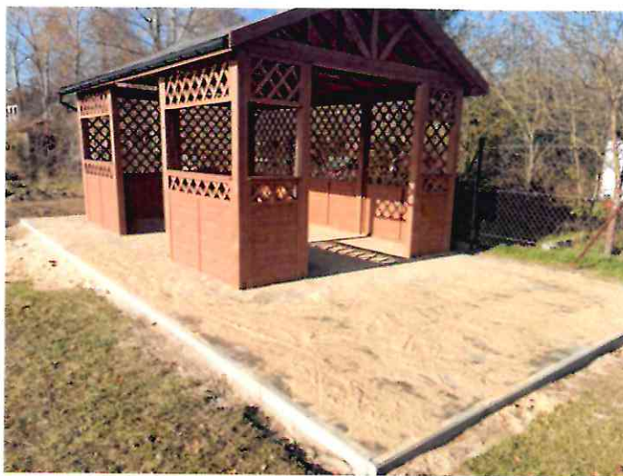
KSIEŻY MŁYN --- >