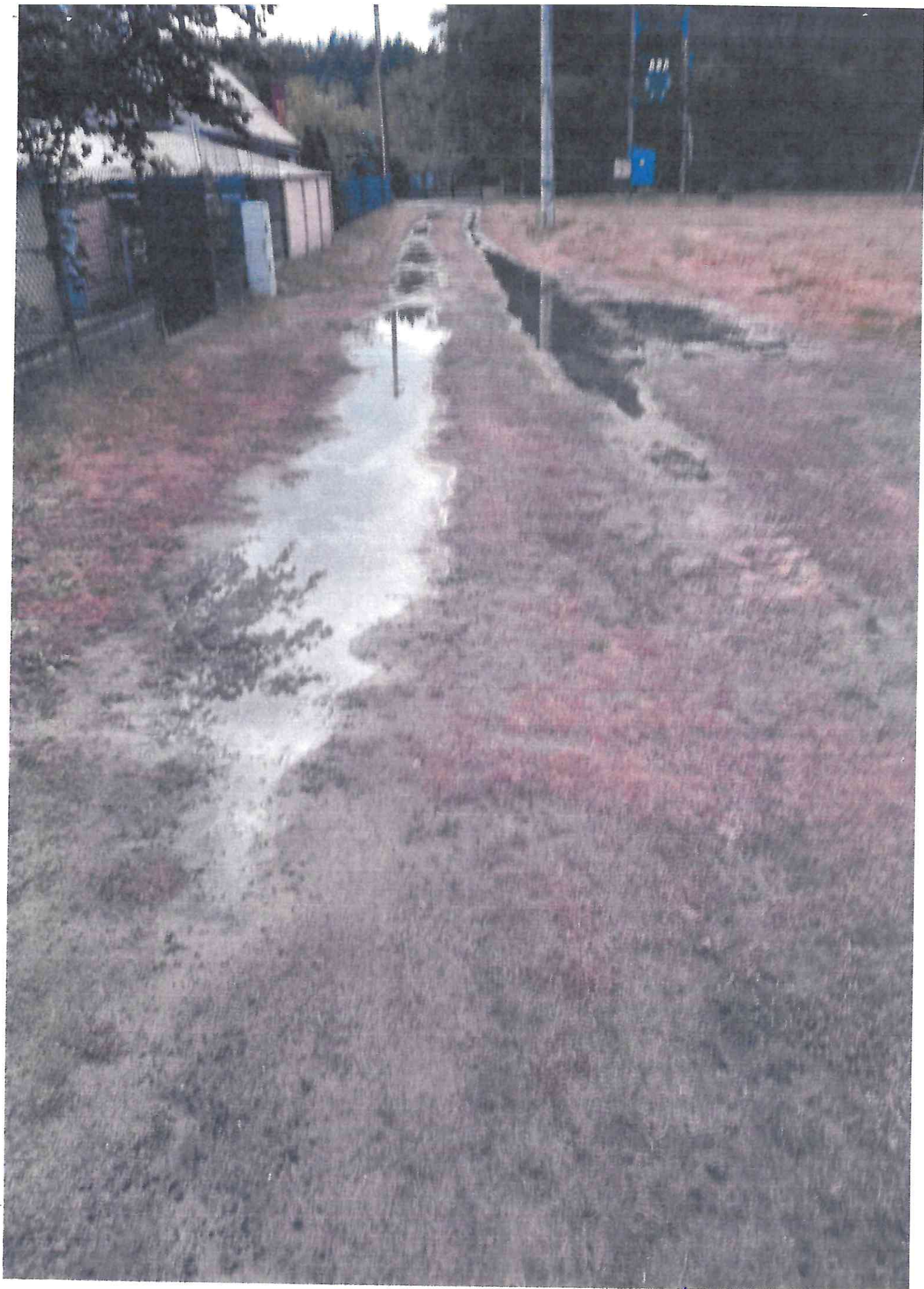
Telefonni e 18.0000